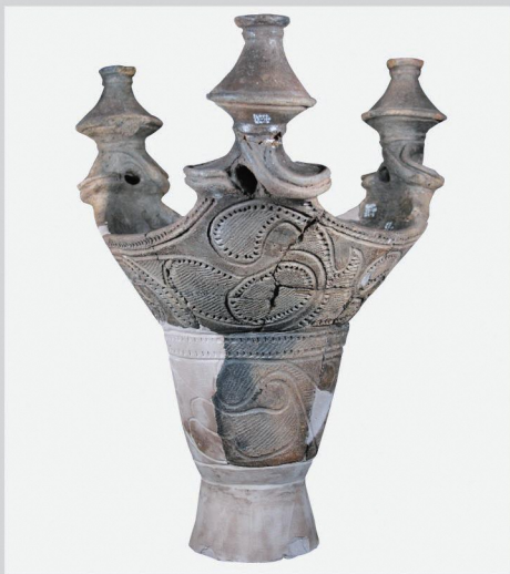
秋田県指定文化財 秋田県大湯環状列石 台付深鉢形土器 (鹿角市教育委員会所蔵)