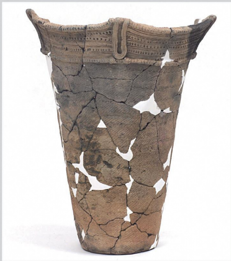
重要文化財 青森県三内丸山遺跡 深鉢形土器 (三内丸山遺跡センター所蔵)