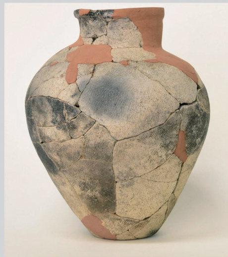
青森県亀ヶ岡遺跡 壺形土器 (つがる市教育委員会所蔵)