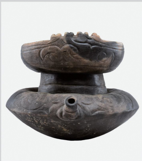
重要文化財 青森県是川中居遺跡 注口土器 (八戸市埋蔵文化財センター—是川縄文館所蔵)