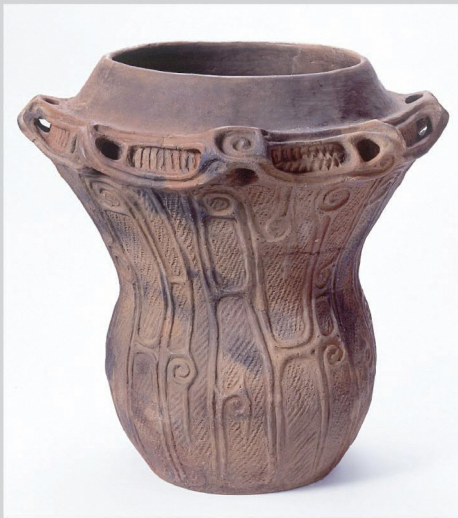
岩手県御所野遺跡 深鉢形土器 (一戸町教育委員会所蔵)